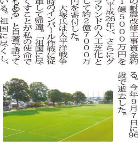
耐震改修工事資金約1億5000万円を平成26年、さらにグラウンドの人工芝化として約2億7000万円を寄付した。