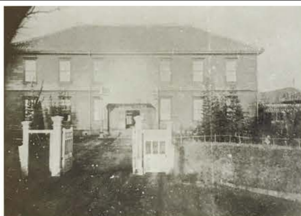
現在記念館として残っている創立時の本館