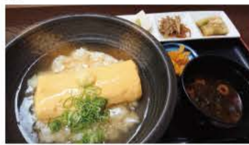
京風出し巻き玉子あんかけ丼

「気軽に京料理が楽しめる」と評判の同店がスタート。メインは天婦羅、焼き魚、出し巻き玉子、豚の生姜焼き、鳥の唐揚げ、チキンカツ、チキンス 「京風出し巻き玉子あんかけ丼」が人気。ランチ、ディナー共通で、1000円(税別)のおばんざい三種盛り(香の物、赤だし、お茶付き)が、1000円(税別)で楽しめる。是非この機会に本格的な京料理を味わってみては。 芳賀町下高根3-932-4040 ☎028-678-8486