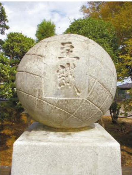
至誠とは、人を欺かず、また己を欺かず、自己の良心を尊び、善と信じることは必ず実行する